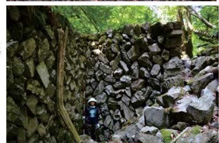
写真下:都内唯一の風穴遺構「檜原風穴」(檜原村)